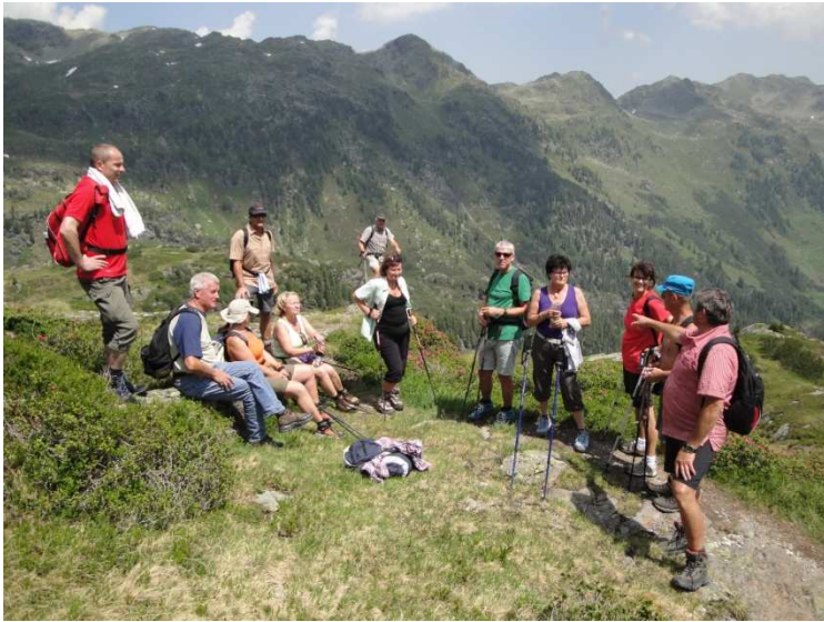
15 Personen gingen über einen Steig wieder zur Bergstation zurück...